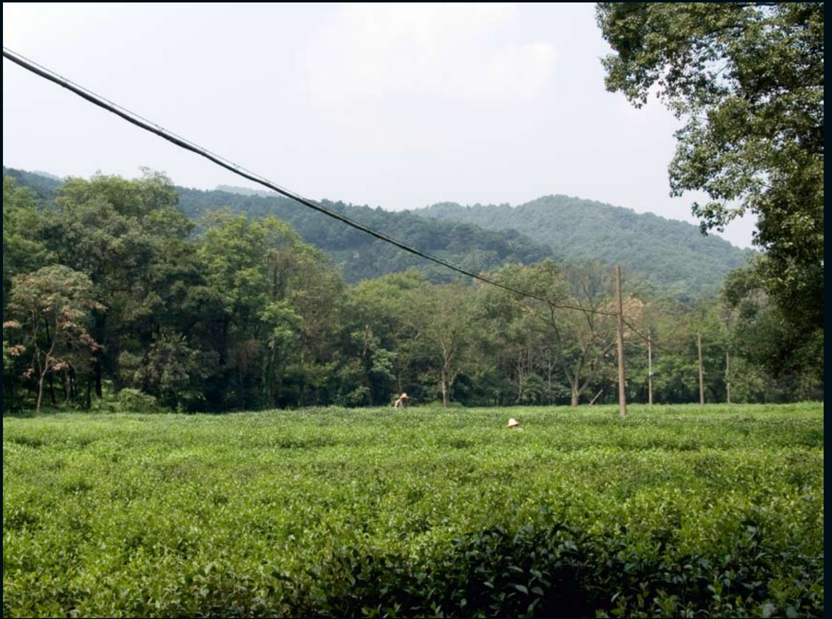
RECEIVING THE WORLD Hangzhou, China, 2008 Umm Said, Qatar, 2008