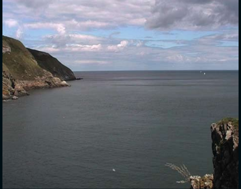
RECEIVING THE WORLD, 2008 Åland Islands, Finland, 2008 Howth, Ireland, 2008 Balf, Hungary, 2008